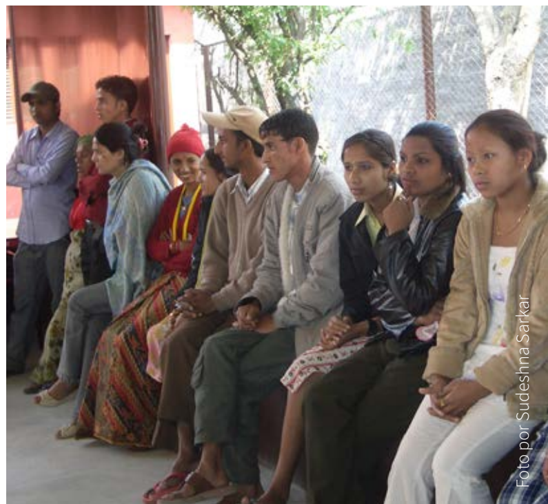
Refugiados bhutaneses en Nepal

Por esto, a menudo los refugiados se unen para formar comunidades basadas en un trasfondo étnico o cultural compartido. Se apoyan a preservar su cultura, construir hogares, y encontrar los medios para sobrevivir en su nuevo país; y a menudo sueñan con el día que puedan regresar a su verdadero hogar.