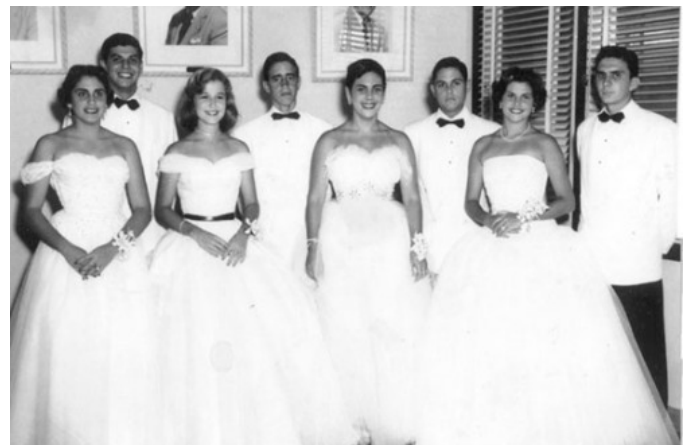
Un baile de debutante en Cuba en 1955

A pesar de estos logros, los principios del machismo todavía dominaban en la casa. Se esperaba que