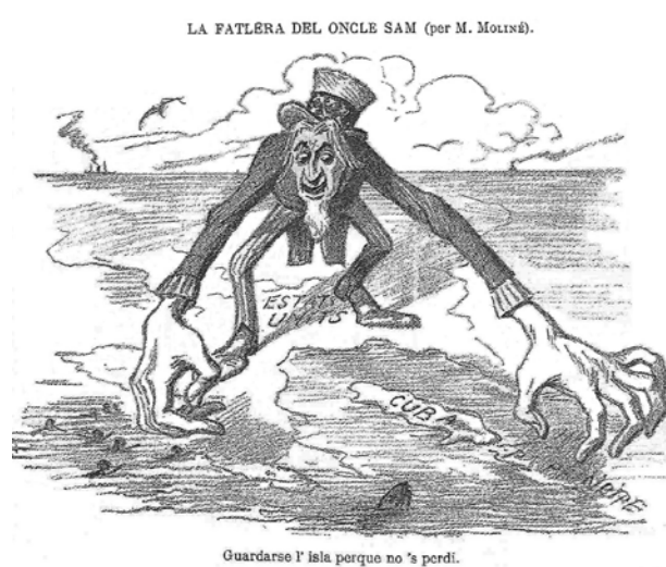
Un dibujo político de España en 1896. Critica el imperialismo estadounidense en Cuba.

Unidos se juntó con Cuba en su lucha contra los españoles. La guerra concluyó con el Tratado de París en diciembre de 1898, lo cual dictó que España renunciara dominio de la isla.