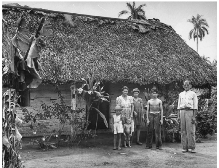
Una familia pobre en el campo de Cuba en 1944.

A lo largo de este periodo de inestabilidad política, La Habana experimentó mucho desarrollo económico. Entre la independencia y la revolución, La Habana crecía mientras la economía de azúcar en Cuba progresaba. En los años 50, La Habana era una "ciudad reluciente y dinámica." Era un centro para turismo para celebridades estadounidenses y la industria del entretenimiento prosperaba. Los Estados Unidos ejerció gran influencia sobre Cuba en esta época. El turismo y la inversión exterior cambiaron el clima cultural de La Habana. A pesar de la agitación política de Cuba, muchos en La Habana la pasaban bien. En la década antes del ascenso de Fidel Castro, Cuba tenía el quinto más alto