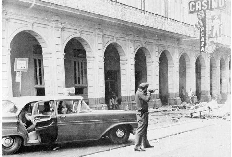
Un policía dispara a personas saqueando un casino en La Habana el primer de enero de 1959

En comparación con las áreas rurales, el régimen de Castro abandonó a La Habana. Castro paró toda actividad privada en el mercado de bienes inmuebles y nacionalizó la construcción. No remodeló el centro de la ciudad, aunque agregó algunos edificios. Quizás lo más importante fue que prohibió la construcción especulativa. Debido a esas reglas y a la disminución del turismo estadounidense en Cuba, La infraestructura en La Habana dejó de crecer. El autor Belmont Freeman escribe, “Si no fuera por la revolución en 1958, es una certeza que el Malecón sería flanqueado por rascacielos, Avenida del Puerto reemplazado por una autopista elevada, el barrio El Vedado reconstruido, y el campo envolvente devorado por la dispersión de los suburbios...La Habana ha sufrido gravemente de cincuenta años de abandono, pero por lo menos su legado arquitectónico rico y los barrios históricos no fueron erradicados por renovación urbana ni desarrollo desenfrenado con fines de lucro.” Antes de la revolución, La Habana florecía y crecía. Este desarrollo terminó en 1959. La élite de Cuba – específicamente, las clases altas en La Habana – profundamente se opusieron a las reformas extensas de Fidel Castro. Muchos de ellos habían ganado sus fortunas en la industria del turismo, lo que ahora sufría mucho. El dinero que fundó los nuevos programas sociales vino directamente de las manos de los ricos. Muchos habaneros de la clase alta se sentían acosados por el régimen nuevo, y huyeron para los Estados Unidos.