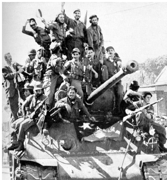
Fidel Castro y sus fuerzas entrando La Habana en enero de 1959

El primero de enero, 1959, las fuerzas de Fidel Castro entraron a La Habana y Fulgencio Batista huyó del país. Castro lo reemplazó como presidente en julio de ese mismo año. Los cubanos habían estado tan descontentos con Batista, que le dieron la bienvenida al cambio. Por eso, Castro disfrutó de