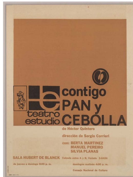
Un folleto para la versión del Teatro Estudio de Contigo Pan y Cebolla , de 1965

http://content.cdlib.org/ark:/13030/hb4c6009hf/